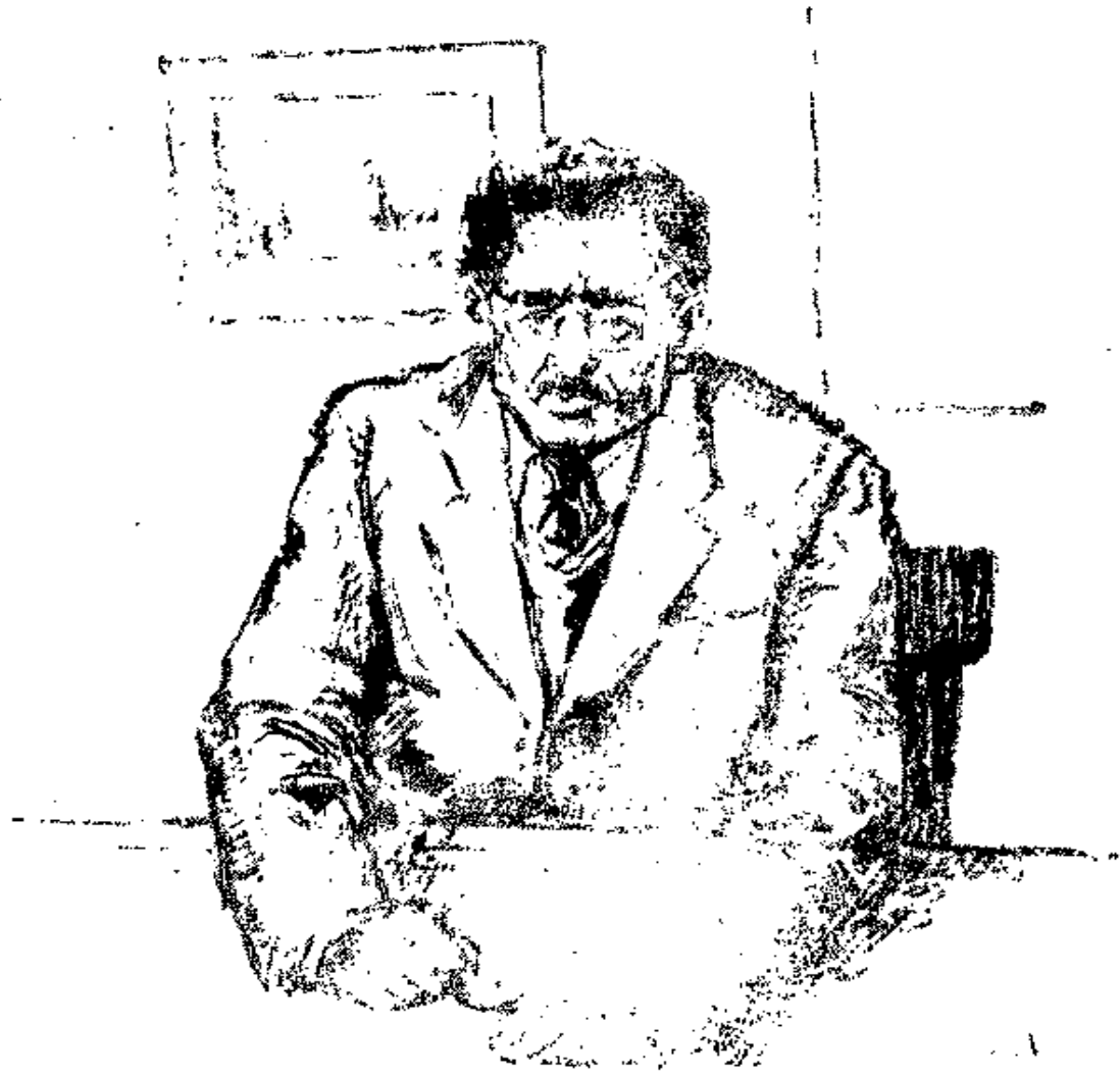
وارتمی علی مقعدہ وهو یقول لنفسه : ائی مریض